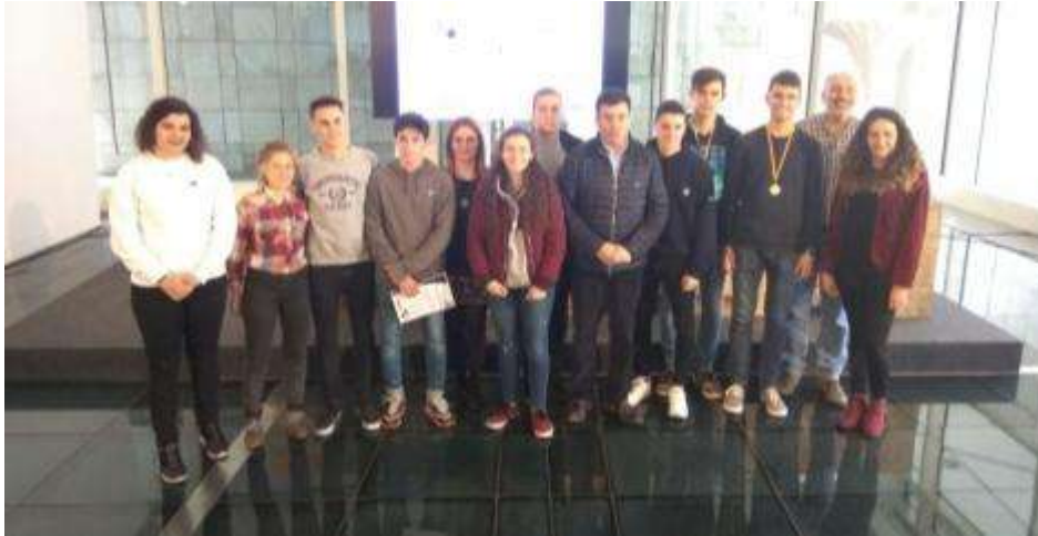
Imagen de los diez primeros clasificados

Además de la prueba los participantes de la olimpiada tuvieron actividades paralelas.