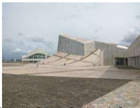
Ciudad de la Cultura. Santiago de Compostela.

Por su parte, durante la realización del test las personas acompañantes pudieron disfrutar a su vez de otra visita al Museo do Pobo Galego, para visitar la Ciudad de la Cultura santiaguesa, lugar donde, además, se procedió a celebrar la entrega de premios. Por último, se realizó una comida de clausura como despedida y finalización de esta actividad, llevándose los participantes y acompañantes una buena sensación de la experiencia vivida.