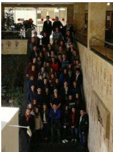
Foto de Familia. Participantes, Profesores, Organizadores y Colaboradores en la III Fase Local de Salamanca de la Olimpiada de Geografía.

Casi medio centenar de alumnos participantes, un abulense ganador de distrito, seguido de dos salmantinos, y el IES Isabel la Católica vencedor en Castilla y León en la categoría de centros.