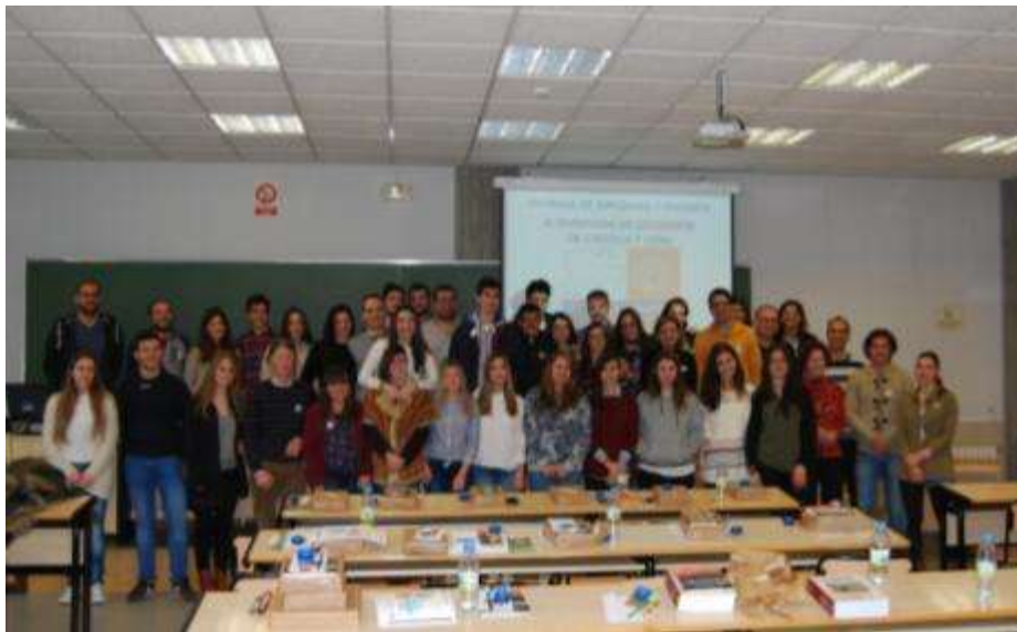
Foto de Familia. Participantes, Profesores, Organizadores y Colaboradores en la III Fase Local de León de la Olimpiada de Geografía.

El Colegio Divina Pastora, segundo en la categoría de centros.