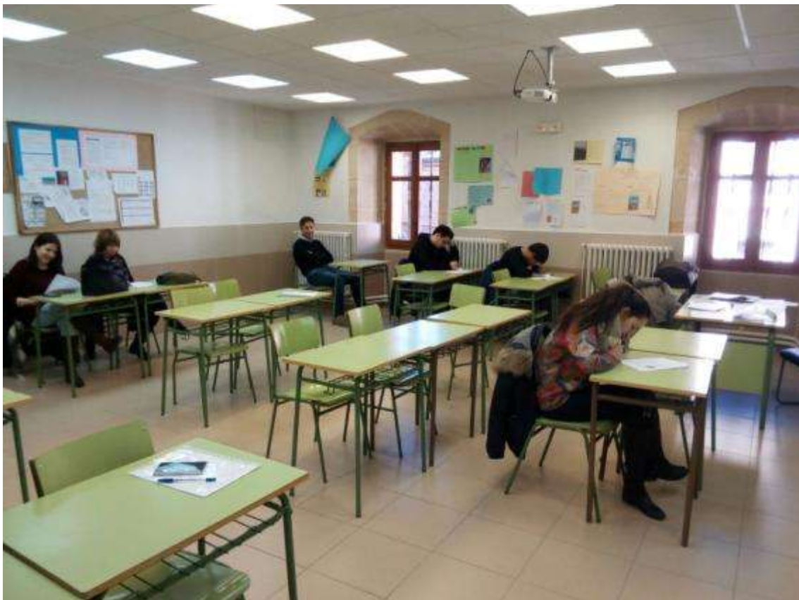
Realización de la fase previa en el IES Antonio Machado, de Soria

Primera edición de la Olimpiada de Geografía en Soria, obteniendo como recompensa un segundo puesto en el Distrito de Valladolid y la tercera plaza en la clasificación de centros.