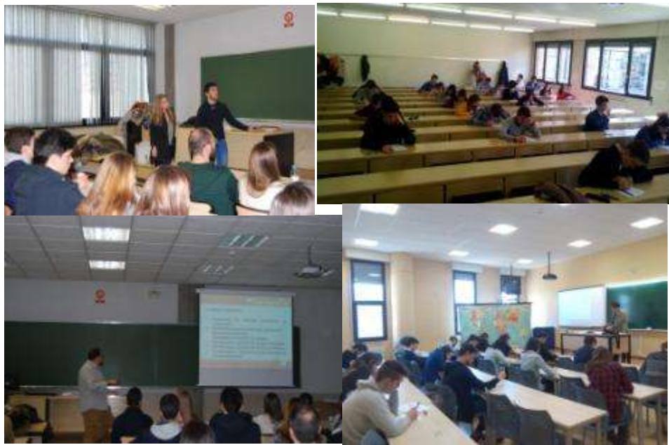
Diferentes momentos de la Olimpiada en las cuatro sedes

Ya se conocen los ganadores de la III Fase Regional de la Olimpiada de Geografía de Castilla y León, celebrada el día 12 de marzo en León, Salamanca, Soria y Valladolid. Los tres primeros clasificados de cada distrito universitario, nueve alumnos en total, representarán a Castilla y León en la VII Olimpiada Estatal de Geografía que se disputará en Salamanca, los días 15, 16 y 17 de abril.